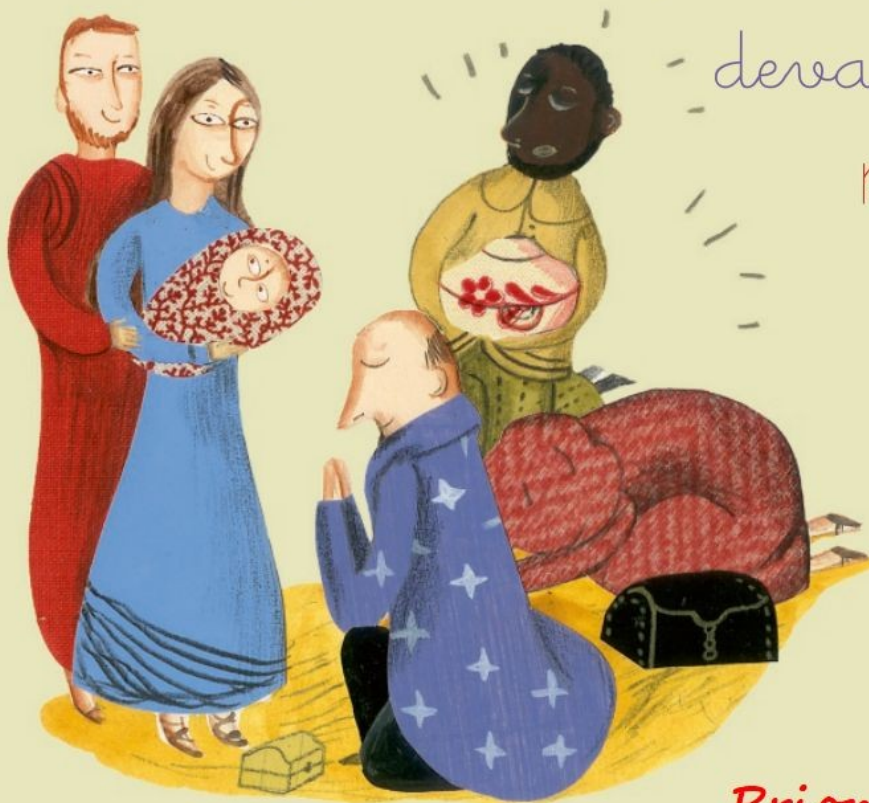
Illustration : Cécile Gambini