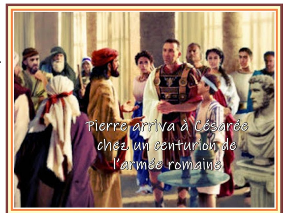
Pierre arriva à Césarée chez un centurion de l'armée romaine

En ces jours-là, quand Pierre arriva à Césarée chez un centurion de l'armée romaine, il prit la parole et dit : « Vous savez ce qui s'est passé à travers tout le pays des Juifs, depuis les commencements en Galilée, après le baptême proclamé par Jean : Jésus de Nazareth, Dieu lui a donné l'onction d'Esprit Saint et de puissance. Là où il passait, il faisait le bien et guérissait tous ceux qui étaient sous le pouvoir du diable, car Dieu était avec lui. Et nous, nous sommes témoins de tout ce qu'il a fait dans le pays des Juifs et à Jérusalem. Celui qu'ils ont supprimé en le suspendant au bois du supplice, Dieu l'a ressuscité le troisième jour. Il lui a donné de se manifester, non pas à tout le peuple, mais à des témoins que Dieu avait choisis d'avance, à nous qui avons mangé et bu avec lui après sa résurrection d'entre les morts. Dieu nous a chargés d'annoncer au peuple et de témoigner que lui-même l'a établi Juge des vivants et des morts. C'est à Jésus que tous les prophètes rendent ce témoignage : Quiconque croit en lui reçoit par son nom le pardon de ses péchés. » – Parole du Seigneur.