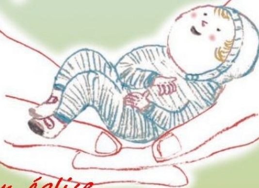
Illustration : Claire Perret