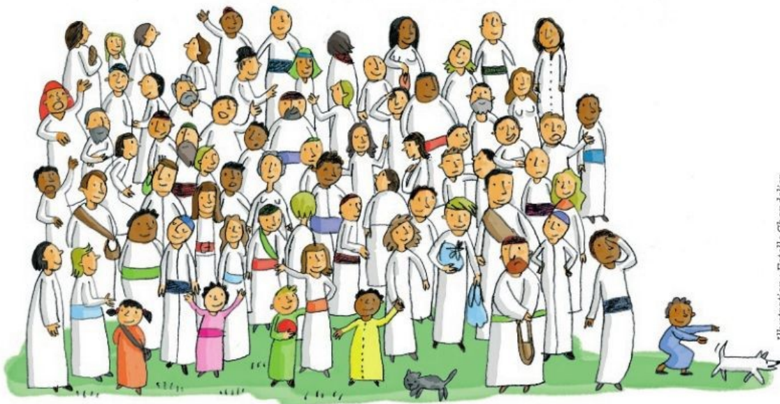
Illustration : Estelle Chandelier