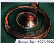
Buenos Aires, 1992-1996