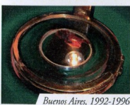
Buenos Aires, 1992-1996