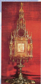
Miracle Eucharistique de Bois-Seigneur-Isaac, Belgique (1405). Relique du Corporal ensanglanté.

L 'exposition de Carlo propose une sélection des principaux Miracles Eucharistiques (environ 136, rassemblés en 166 panneaux plastifiés de 60 x 80) qui se sont produits au cours des siècles dans divers pays du monde, et qui ont été reconnus par l'Église. Au travers de ces panneaux, il est possible de « visiter virtuellement » les lieux où se sont manifestés ces Miracles.