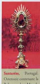
Santarém, Portugal. Ostensoir contenant la Relique du Miracle Eucharistique survenu en 1247. Là aussi, l'Hostie s'est transformée en Chair.