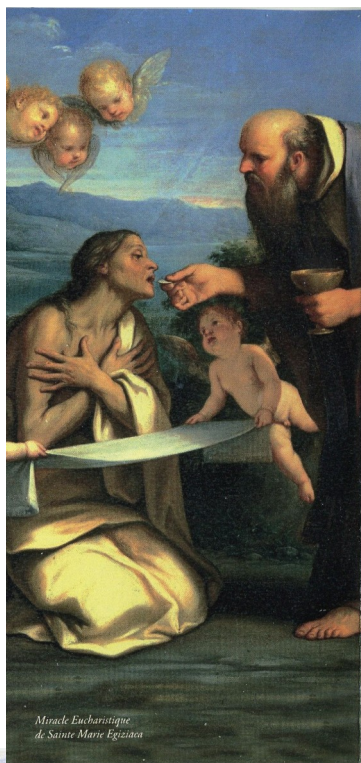
Miracle Eucharistique de Sainte Marie Egiziaia