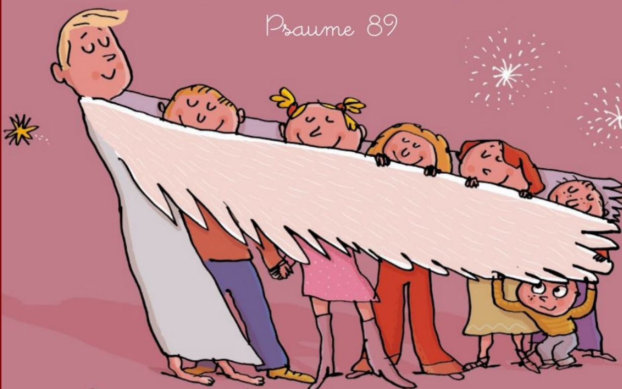
Illustration : Pascal Lemaître