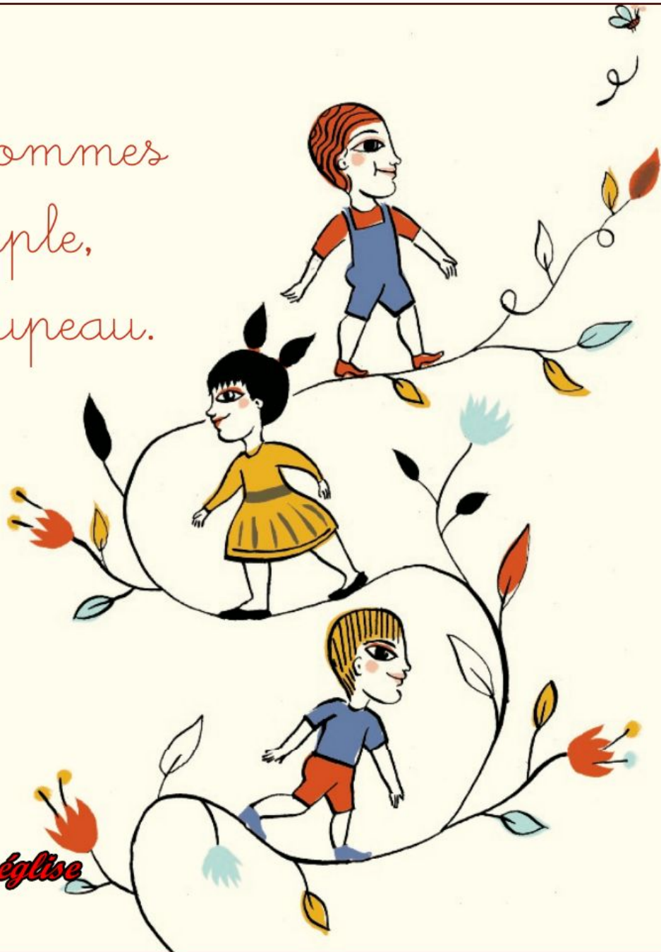
Illustration : Aurore Petit