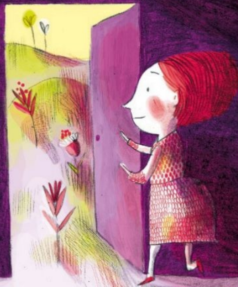
Illustration : Clotilde Perrin