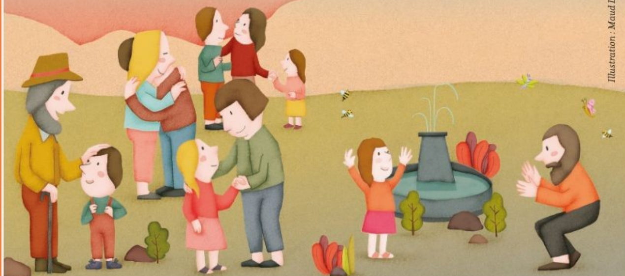
Illustration : Maud Legrand