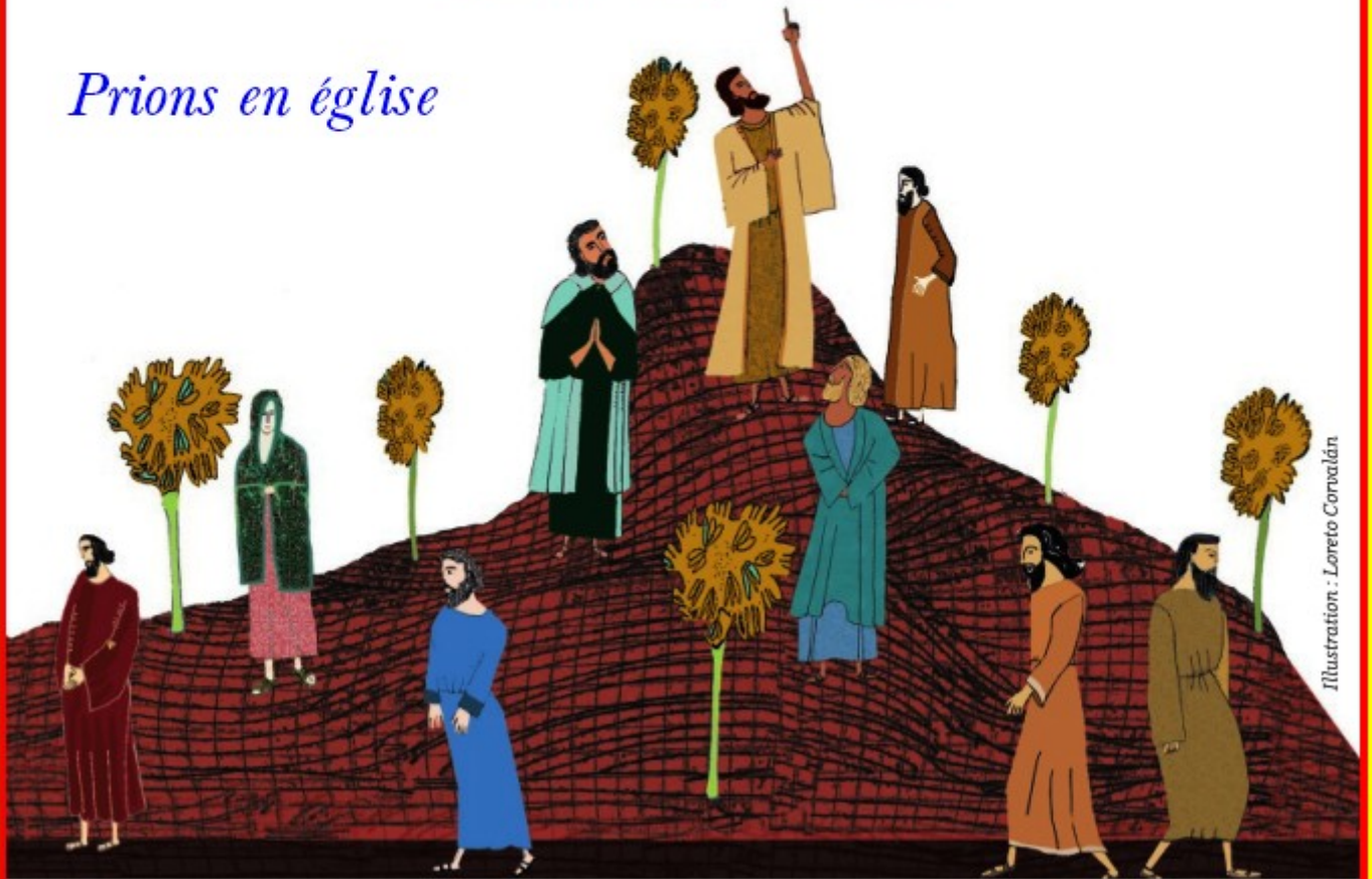
Illustration : Loreto Corvalán