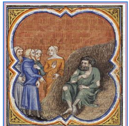
Job sur le fumier visité par ses amis et sa femme; illustrateur de la Bible de Petrus Comestor ; 1372 , miniature ; Musée Meermanno, La Haye

Job prit la parole et dit : « Vraiment, la vie de l'homme sur la terre est une corvée, il fait des journées de manœuvre. Comme l'esclave qui désire un peu d'ombre, comme le manœuvre qui attend sa paye, depuis des mois je n'ai en partage que le néant, je ne compte que des nuits de souffrance. À peine couché, je me dis : "Quand pourrai-je me lever ?" Le soir n'en finit pas : je suis envahi de cauchemars jusqu'à l'aube. Mes jours sont plus rapides que la navette du tisserand, ils s'achèvent faute de fil. Souviens-toi, Seigneur : ma vie n'est qu'un souffle, mes yeux ne verront plus le bonheur. » – Parole du Seigneur.